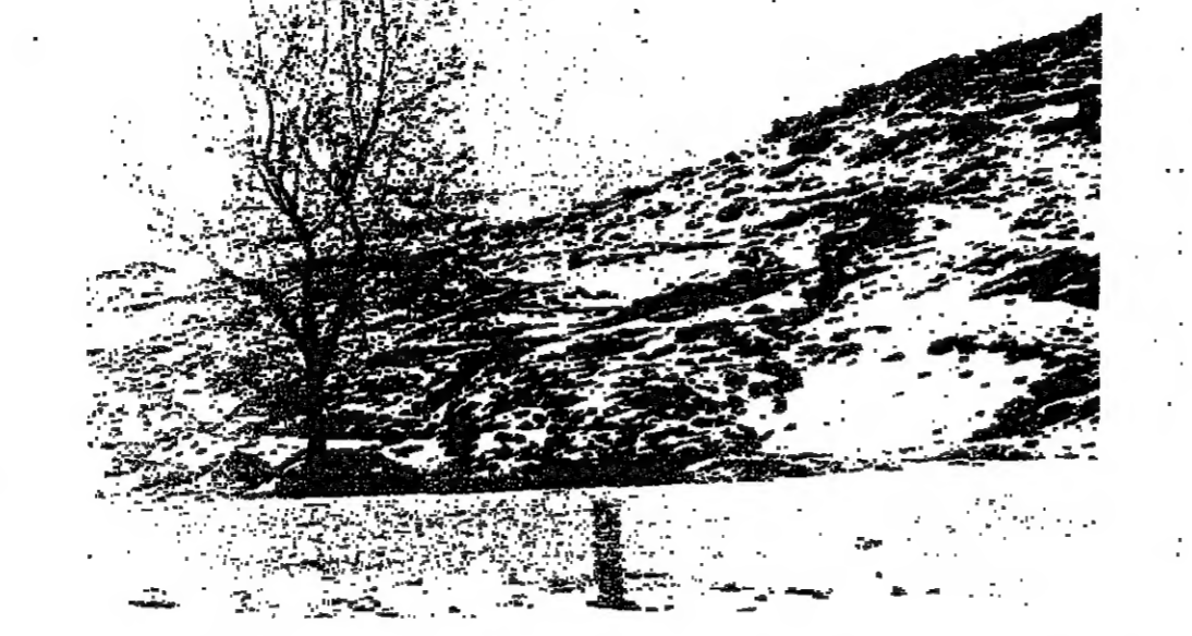
طريق ضهر البيدر سائكة .. ولا سيارات